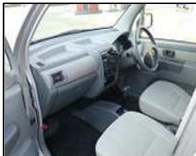
ステップ-1 助手席側のドアを開ける。