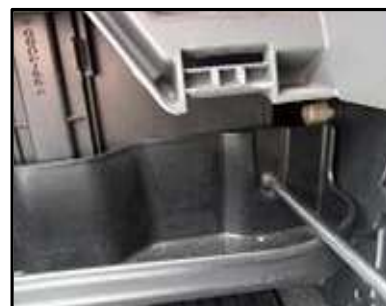
ステップ-6 助手席側ダッシュボード下のトレイを固定してる右側のねじを抜く。