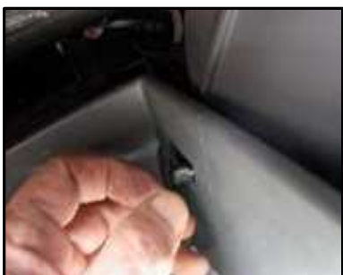
ステップ-4 黒いプラスチックの押さえクリップを引き抜く。