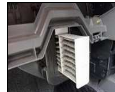
ステップ-14 検査の結果によって、古いエア フィルター・エレメント又は新しいエア フィルター・エレメントをエア・フィ ルター・キャビティに入れる。ここで、 下のエレメントを入れる。

注意： 上のエレメントの場合、フロント・プレ ートの上の角が丸くなっていて、下の 角が90°になっている。