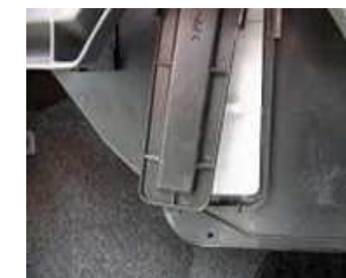
ステップ-16 エア・フィルター・キャビティ カバーの上のタブを受けのスロットに 入れ、下のタブが受けのスロットとラ インアップする。

再確認： 上のエレメントのフロント・プレート の上の角が丸くなっていて、 下の角が90°になっている。 下のエレメントのフロント・プレート の上の角が90°になっていて、 下の角が丸くなっている。