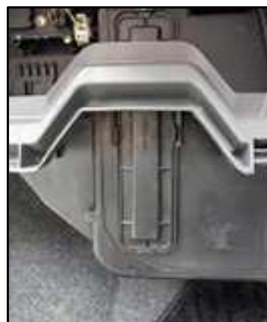
ステップ-9 エア・フィルター・キャビティ カバーの下のタブが抜けるまで 上に押す。