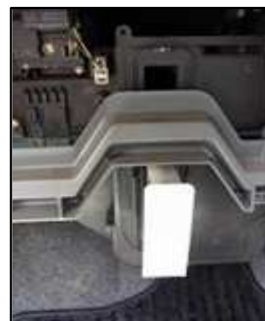
ステップ-13 検査の結果によって、古いエア フィルター・エレメント又は新しいエア フィルター・エレメントをエア・フィ ルター・キャビティに入れる。まず、上 のエレメントから。

注意： 上のエレメントの場合、フロント・プレ ートの上の角が丸くなっていて、下の 角が90°になっている。