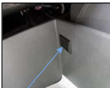
ステップ-3 黒いプラスチックの押さえクリップを確認する。