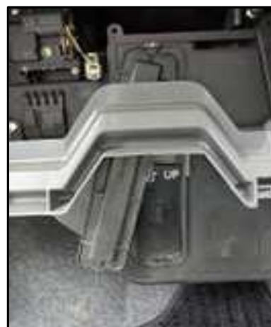
ステップ-10 エア・フィルター・キャビティ カバーを取り外す。