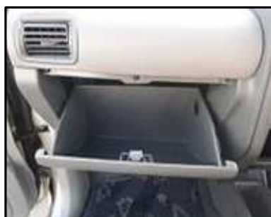
ステップ-2 グローブ・ボックスを開ける。