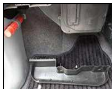
ステップ-8 助手席側ダッシュボード下の トレイを外す。