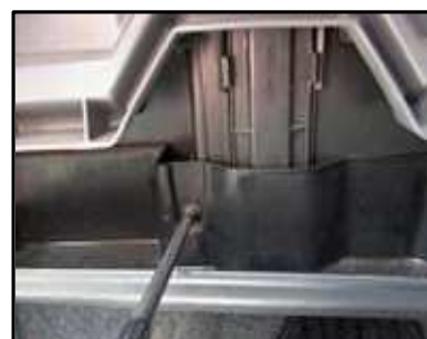
ステップ-7 助手席側ダッシュボード下のトレイを固定してる左側のねじを抜く。