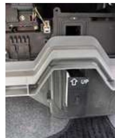
ステップ-12 上のエア・フィルター・エレメントを エア・フィルター・キャビティから 抜く。 エア・フィルター・エレメントを 検査する。