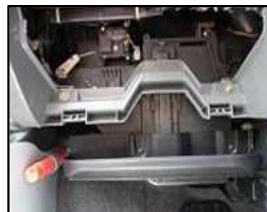
ステップ-5 グローブ・ボックスを ダッシュボードから取り出す。