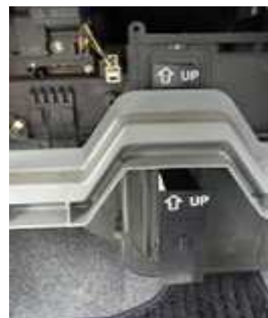
ステップ-11 下のエア・フィルター・エレメントを エア・フィルター・キャビティから 抜く。